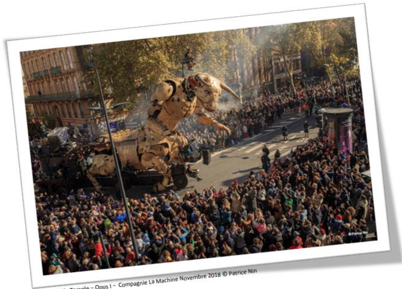
Le Gardien du Temple – Opus I – Compagnie La Machine Novembre 2018

https://youtu.be/lvhQTxPNAJ0?si=PHICnB-OF_GIZjji