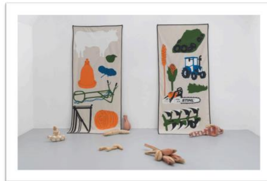
Aurélie Ferruel et Florentine Guédon, "Culte", 2017, tissu, coton, lin, peinture et bois, collection des artistes

Les Abattoirs, Musée – Frac Occitanie Toulouse, proposent avec cette exposition d'explorer les liens entre les artistes et les paysans. Face aux enjeux écologiques et sociaux, et aux répercussions des activités humaines sur la nature, l'alimentation et la santé, l'un des défis de notre temps est le rapport de l'humain au vivant. À la croisée de ces enjeux, les agriculteurs, qui sont au tout début de la chaîne de production alimentaire, occupent une place fondamentale.